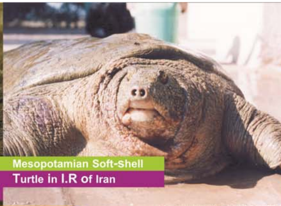
Mesopotamian Soft-Shell Turtle in I.R of Iran