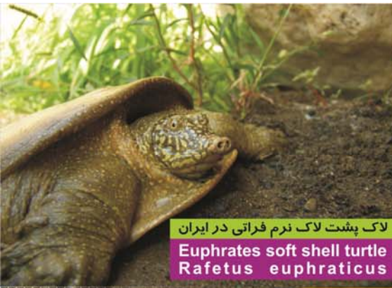
لاک پشت لاک نرم فراتی در ایران Euphrates soft shell turtle Rafetus euphraticus